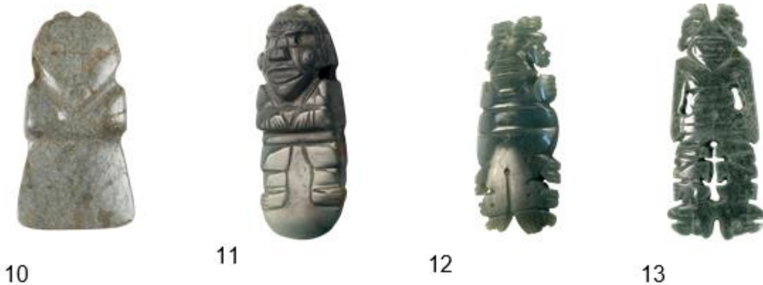
Figuras 10. Biselado inicial de los jades con forma de hacha (500 a.C.). Figuras 11,12, 13. Detalles de proceso de tallado y calado sobre el filo utilizado para conformar los pies en colgantes de jade antropomorfos (300 d.C.)

En el caso de las figurillas caladas, el artesano lapidario aprovechó el biselado del filo para ir dándole forma al calado y conformar los diseños que se pondrían en cada figurilla. Llama la atención que la mayoría de este tipo de colgantes calados procede de la Región Arqueológica Central-Caribe, quizás una variante local del estilo de hacha de la Gran Nicoya.