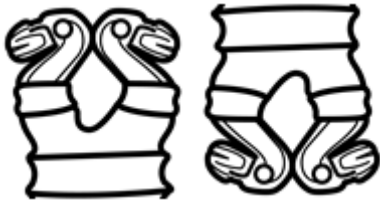
Figuras 4 y 5. Perspectivas de los planos de los pies.

Las cabezas de estas aves son aplanadas en la parte superior, desde donde se proyectan hacia los lados picos delineados con incisos sobre los que sobresale una protuberancia similar a la cera que presenta la pava (Ghiselle Alvarado comunicación personal, 2020).