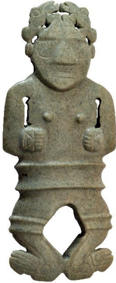
Figura 3. Colgante con personaje tallado en nefrita. N°4507, colección Museo del Jade y de la Cultura Precolombina. INS.

"Tableta. Figura antropomorfa, de pie. Presenta "náhuatl", figuras aviformes. Dos caras antropomorfas constituyen las manos y dos figuras zoomorfas las piernas. Banda horizontal en la cintura y rodillas. Perforación bicónica para la suspensión."